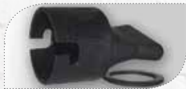
MÖ50301 (NU + SK) MÖ60301 (KU)

Mit dem Adapter und einer Düse vermörteln Sie Klappen mühelos.