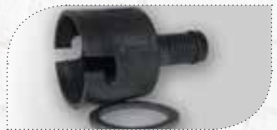
MÖ50302 (NU + SK) MÖ60302 (KU)

Düse mit 8 x 50 mm Ausgang. Für Mauerspalt mit wenig Platz.