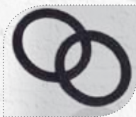
MÖ20210 Modell 500/40 NU 2 Ersatzdichtungen, passend für sämtliche Adapter und Düsen.