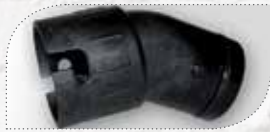
MÖ50304 (NU + SK) MÖ60304 (KU) 30 Grad Adapter

Die optimale Lösung, um schwer zugängliche Mauerspalt mit Mörtel zu füllen.