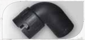
MÖ50303 (NU + SK) MÖ60303 (KU) 90 Grad Adapter

Mit dem Adapter und einer Düse vermörteln Sie das Kopfstück einer Zarge oder Zargen mit wenig Platz schnell und einfach.