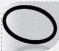
MÖ21104 Modell 500/40 KU Dichtring für den Düsenverschluss.