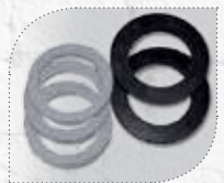
MÖ21101 Modell 500/40 KU Dichtungssätze, je 2 Dichtscheiben und 3 Distanzscheiben.