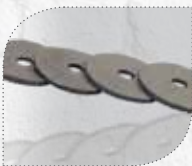
MÖ20101 Modell 500/40 NU Kolbdichtung (Chromium), bestehend aus 4 Dichtscheiben.